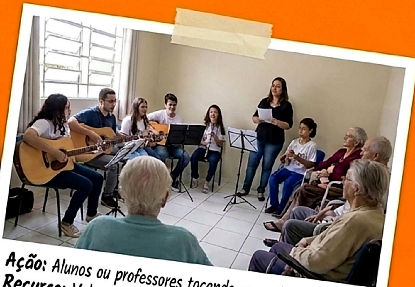
Ação: Alunos ou professores tocando em asilos, APAEs, etc. Recurso: Voluntariado e instrumentos.