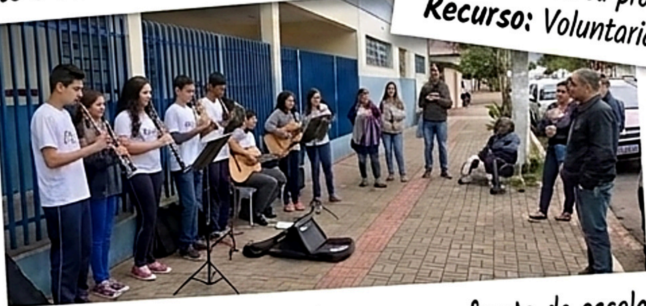
Ação: Intervenção tocando na rua, na frente da escola. Recurso: Espaço público e instrumentos.

Ações simples, orgânicas e poderosas que engajam a comunidade e expandem o impacto da escola além de seus muros. Sem necessidade de grandes produções ou palco central, usando os recursos já existentes.