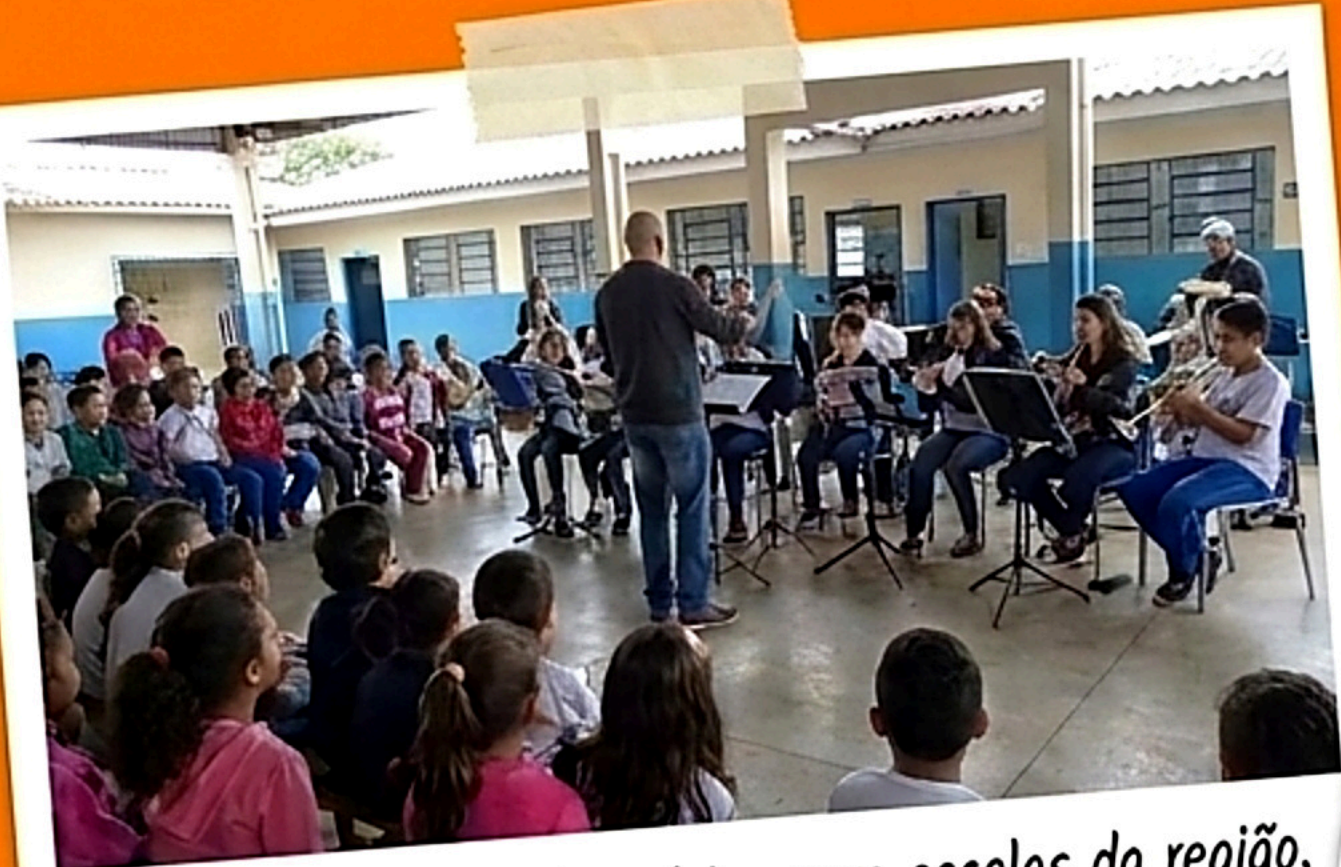
Ação: Escola levando música para escolas da região. Recurso: Transporte e instrumentos da escola.